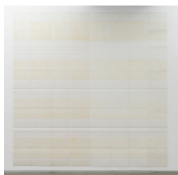
Michel Parmentier 31 mai 1991 III , 1991 Oil-bar blanc appliqué à plat, verticalement, sur papier-calque, 7 bandes horizontales alternées de 38 cm de largeur (4+3) et, en haut et en bas, 2 bandes partielles vierges de 19 cm ; 304 x 300 cm