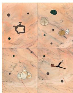
Daniel Dewar & Grégory Gicquel Stone Marquetry with Taps, Shell, Soap, Pipe and Flute , 2017 Marbre, pierre calcaire, granit, onyx ; 200 x 160 x 2 cm Unique