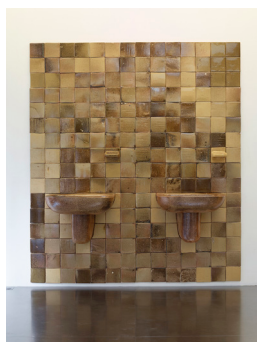
Daniel Dewar & Grégory Gicquel Stoneware mural with two sinks and two soapdishes , 2016 Grès grand feu contrecollé sur aluminium ; 240 x 210 x 52 cm Unique Production avec le concours du Centre national des arts plastiques (avance remboursable)