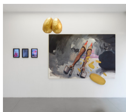
Ashley Hans Scheirl Golden Shower (L'Origine du Monde) , 2017 Acrylique sur toile et carton, 2 objets en papier mâché, 3 vidéos loop sur support USB ; 160/192 x 240 cm