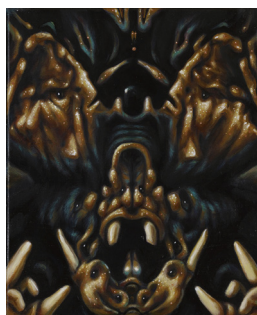
Philippe Mayaux Butterfly Monster , 2018 Techniques mixtes sur toile ; 37,5 x 28,5 cm