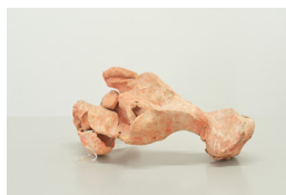
Alina Szapocznikow Forma II , ca. 1964-1965 Argile rose non cuite ; 11,5 x 19,5 x 13 cm Courtesy galerie Loevenbruck, Paris