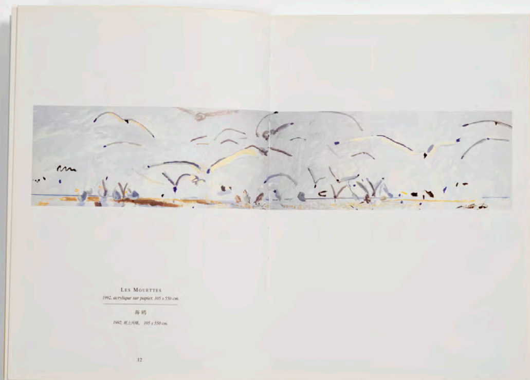
LES MOUETTES 1992, acrylique sur papier, 105 x 550 cm.