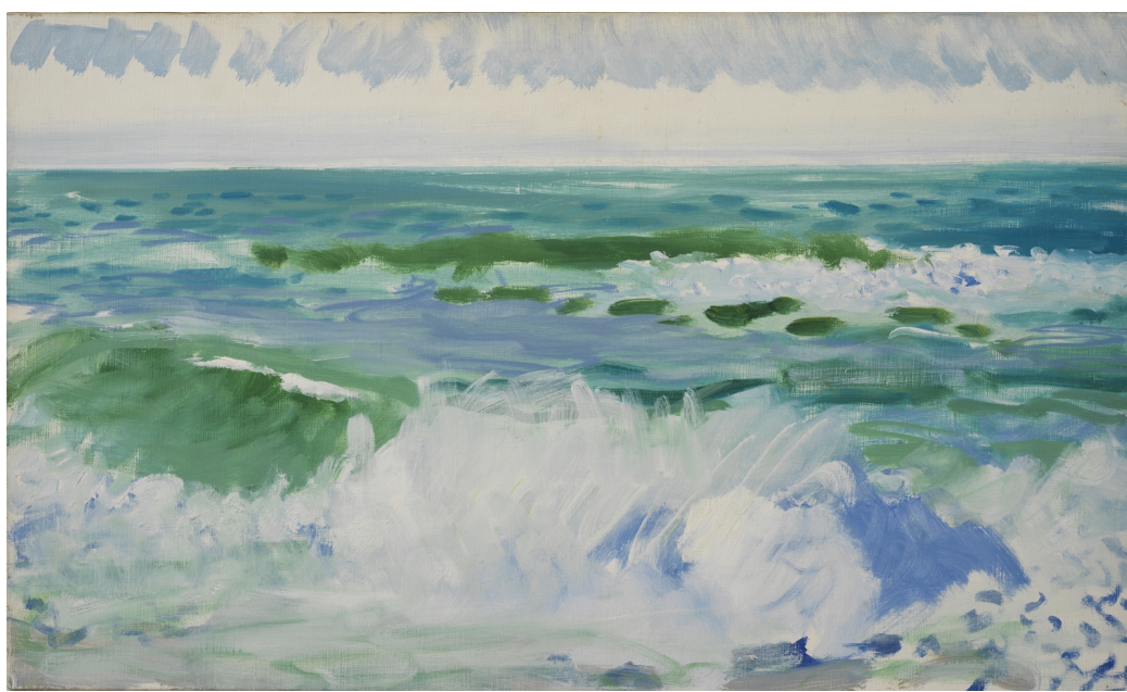
Gilles Aillaud La mer dans tous ses états, 1988

Huile sur toile 33 × 55 cm N° Inv : GA200303