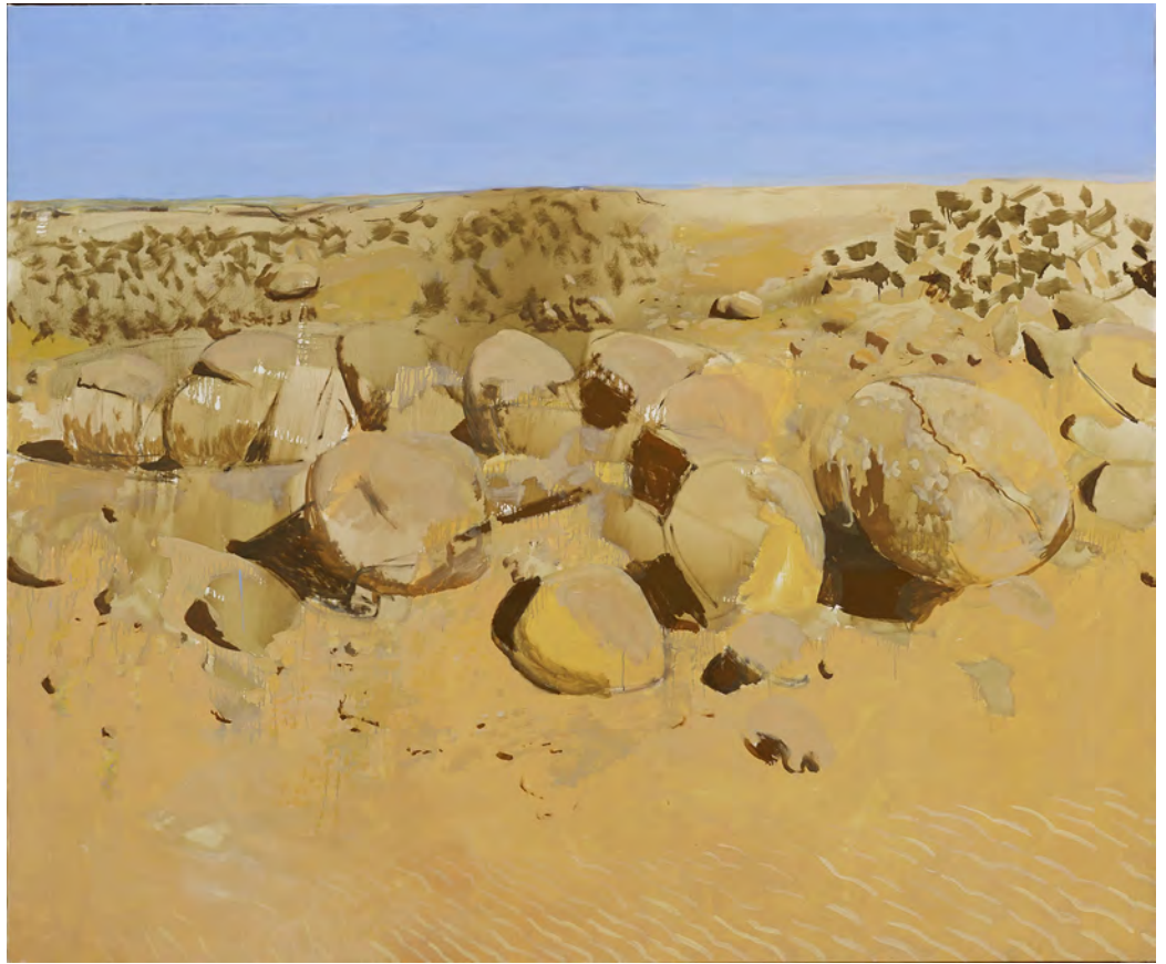
Gilles Aillaud Désert, 1987

Huile sur toile 168 × 200 cm N° Inv : GA190102